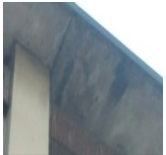
Milano, 09 Gennaio 2014